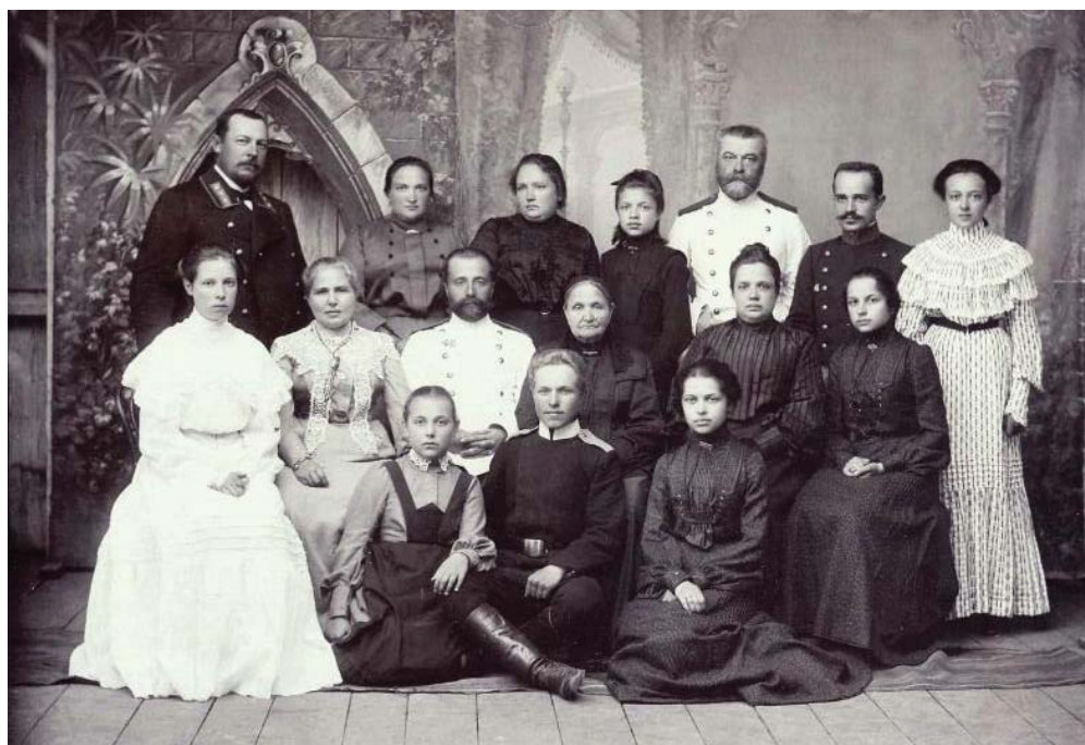
Групповой портрет большой семьи.

Обработка сведений, полученных в ходе переписи 1897 года, заняла более восьми лет. Всего было опубликовано 117 томов, в которых содержалась подробная информация о людях, населявших страну в конце XIX века.